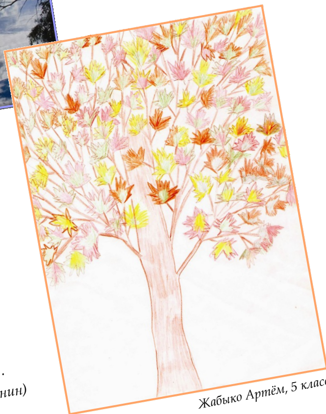
Жабыко Артём, 5 класс

Лето прошло! Оно оставило нам прекрасные воспоминания!