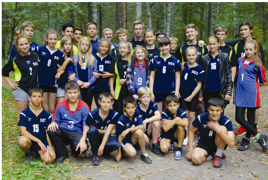
Команда по легкоатлетическому кроссу

В этом команда нашей школы участвует в Спартакиаде школьников Кировского района «Президентские спортивные игры и состязания»!