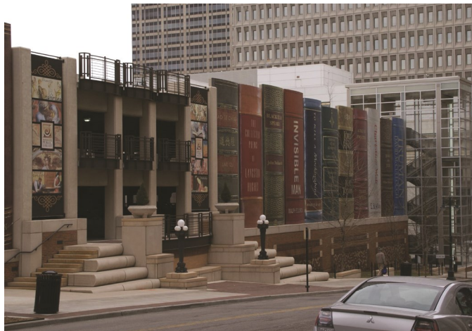
Центральная библиотека в Канзас-Сити – уникальное здание в виде огромной книжной полки с книгами-великанами.

Книги почитались во все века. Раньше, правда, только богатые и знатные люди могли позволить себе такую роскошь. Книги делали из дорогих материалов, создавали целые библиотеки невероятно дорогих, обшиты золотом и обделанными разными драгоценными камнями, книг. Население среднего достатка и читало-то с трудом: сельские школьники ходили разве что в церковную школу, да и то далеко не все. В современном мире доступ в библиотеку открыт каждому и каждому доступна книга во всём её многообразии. Главное захотеть читать. В наше время найти необходимую книгу можно и в интернете, неважно, откуда человек добирается до заветных страниц, главное, что он продолжает любить книги. Сколько бы люди не тверди о деградации человечества, всегда найдутся те, чьи умы будут захвачены книгами. Меняются лишь жанры любимых произведений, но суть, любовь к чтению, остаётся всё той же. В этом мы убедились, побеседовав со школьниками. 33% учеников не читает книг кроме школьной программы. Большая часть учащихся любит читать, правда не является поклонником литературы, которую приходится осваивать в школе. Большая часть (26%) читает разные книги, главное требование,