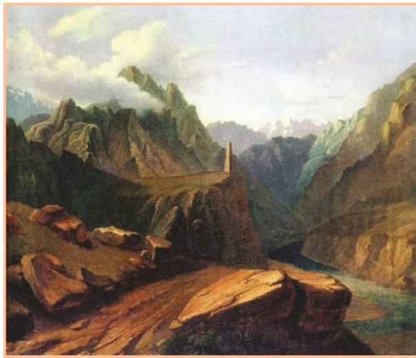
«Башня в Сиони». 1837-1838 гг.

Но наш поэт отличается от своих предшественников и современни-