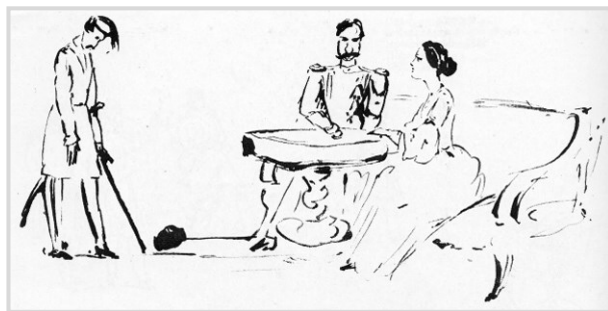
Светская сцена. Рисунок М.Ю. Лермонтова. 1840-1841 гг.

Серьезная мысль была главной чертой его благородного лица, как и всех значительнейших его произведений...<...> Чтобы точнее определить значение Лермонтова в русской и во всемирной литературе, следует прежде всего заметить, что он выше всего там, где становится наиболее НАРОДНЫМ. И что высшее проявление этой народ-