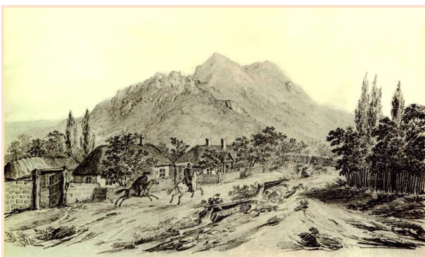
Пейзаж «Бештау около Железноводска»

ков тем, что дал более широкий простор в поэзии картинам природы, и в этом отношении он до сих пор стоит на недосягаемой высоте...»