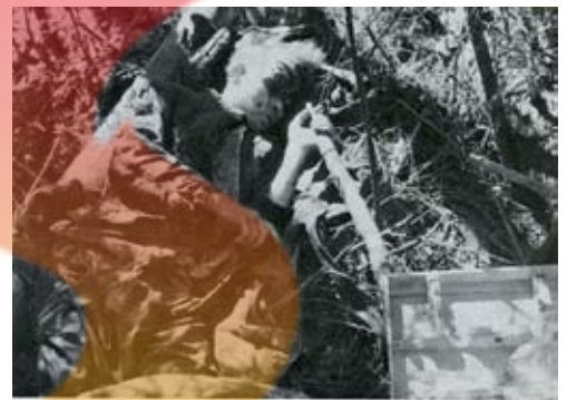
Tragik im Kampf. Russischer Soldat sprach sich selbst, vermutlich, weil er Angst hatte vor der Gefangenschaft, oder weil er kein Eisen nicht mehr ertragen konnte. K'7e

Это события Любанской наступательной операции по прорыву блокады Ленинграда (7 января - 30 апреля 1942 года), после неудачного наступления советских войск. Немцы проводили операцию на Волхове по уничтожению котла 2-ой Ударной армии (населенные пункты Мясной Бор, Спасская Полисть, Мостки).