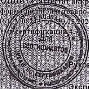
Схема сертификации 4

Акта оценки оказания услуг от 18.05.2021 №0173-СУ ОС продукции и услуг АЯ61.М RA.RU.10АЯ61), протоколов испытаний №№2017гз-2019гз от 23.03.2021, 265п от 16.04.2021 СПб ГБУ ИЛ «СОПНИТ» (аттестат аккредитации РОСС RU.0001.21ПН17), Знак соответствия проставляется на информационной и товаро-сопроводительной документации. Разрешение на применение знака соответствия АЯ61.М08243 от 20.05.2021. Договор № 61-21 от 14.05.2021. Инспекционный контроль 1 раз в 6 месяцев.