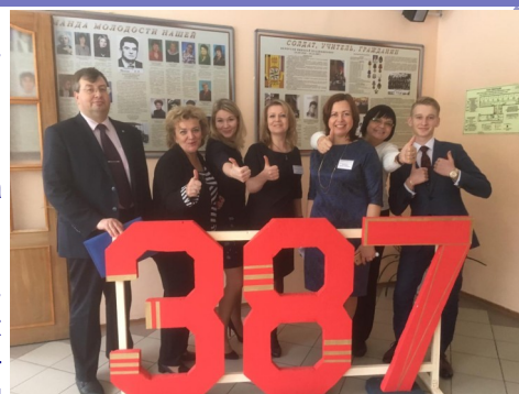
Творческий коллектив проекта

«Нашей задачей было придумать такой проект, который решит проблему профессионального самоопределения современных школьников, а также проблему выбора профиля обучения после 7 класса. Так родилась программа под названием «ПрофильSkills 4.0». Лицей всегда следовал современным стандартам образования. Одна из задач лицея - подготовка учащихся к будущей профессиональной жизни. Сегодня, чтобы быть востребованным на рынке труда, выпускники должны обладать большим набором компетенций. Каждый ученик - это личность, каждый может найти то дело, которым он мог бы заниматься в жизни. Нужно только помочь ему в этом. Необходим индивидуальный подход. Воплощая программу «ПрофильSkills 4.0», мы планируем создать в лицее современное образовательное пространство (smart—пространство), в котором наши лицеисты получают возможность реализовать себя. В smart - пространстве учителя смогут повышать свою квалификацию, провести интересный урок или заняться увлекательным проектом с учащимися. В smart-пространстве учителя и ученики смогут совместно решать различные задачи, работать над проектами. Мы надеемся, что учиться станет еще интереснее».