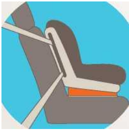
Лицом по ходу движения