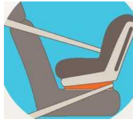
Лицом против движения