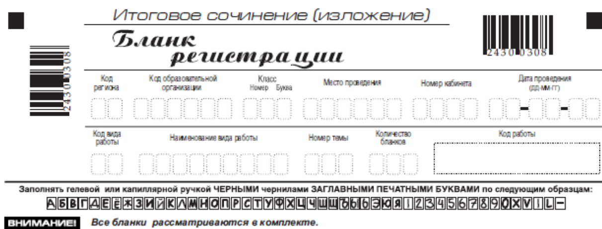
Рис. 2. Верхняя часть бланка регистрации

В верхней части бланка регистрации (рис. 2) расположены: – вертикальный и горизонтальный штрихкоды; – поля для рукописного занесения информации; – строка с образцами написания символов; – поле «код работы» формируется автоматизированно при печати бланков.