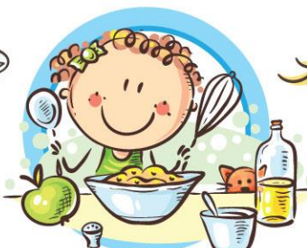
СЛЕДУЙТЕ ПРИНЦИПАМ ЗДОРОВОГО ПИТАНИЯ И ВОСПИТЫВАЙТЕ ПРАВИЛЬНЫЕ ПИЩЕВЫЕ ПРИВЫЧКИ