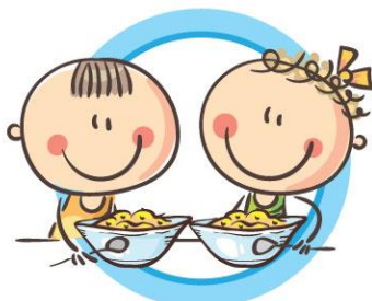
ПИТАЙТЕСЬ КАЖДЫЙ ДЕНЬ ВМЕСТЕ С ОДНОКЛАССНИКАМИ В ШКОЛЬНОЙ СТОЛОВОЙ