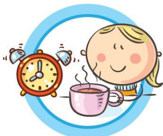
СОБЛЮДАЙТЕ ПРАВИЛЬНЫЙ РЕЖИМ ПИТАНИЯ