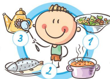
НЕ ПРОПУСКАЙТЕ ПРИЕМЫ ПИЩИ