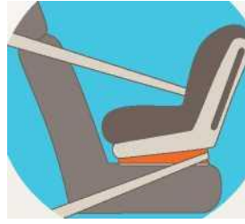
Лицом против движения